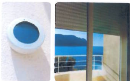
Draadloze Somfy lichtsensor stuurt uw rolluik

Een afstandsbediening geeft u optimale flexibiliteit en bewegingsvrijheid. U zet eenvoudig één of meerdere rolluiken gelijktijdig of onafhankelijk van elkaar in elke gewenste positie, waar u ook bent in of om de woning. Desgewenst combineert u de afstandsbediening met een draadloze tijdklok die zorgt dat op geprogrammeerde tijdstippen het rolluik naar een ingestelde positie gaat.